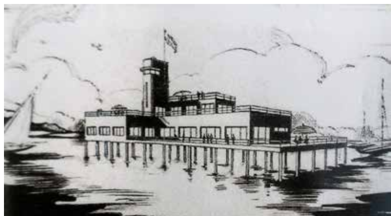
Proyecto del edificio Club Náutico Olivos (Neptunia 1933)