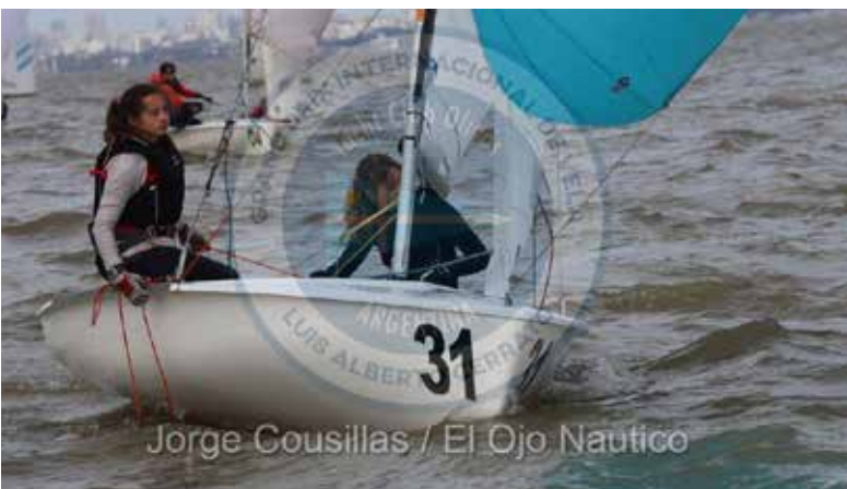
Jorge Cousillas / El Ojo Nautico