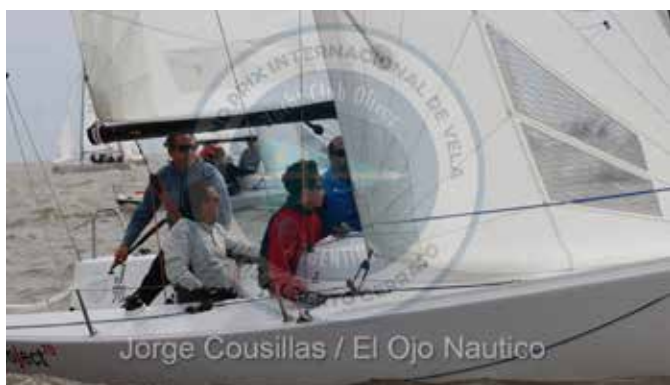
Jorge Cousillas / El Ojo Nautico

¡Felicitaciones a nuestros J70s por la participación y los resultados!