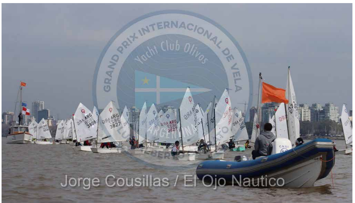
Jorge Cousillas / El Ojo Nautico

¡Felicitaciones Príncipes y a no aflojar que lo mejor está por venir!