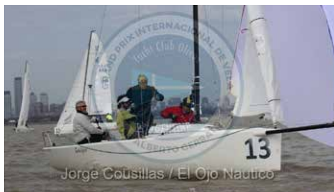
Jorge Cousillas / El Ojo Nautico