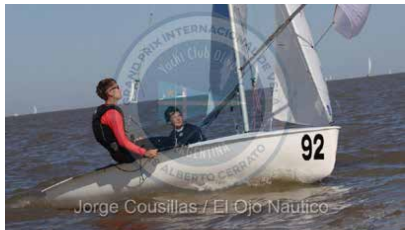
Jorge Cousillas / El Ojo Nautico