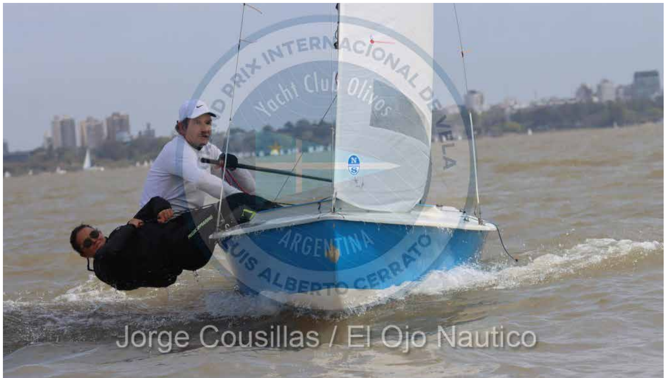
Jorge Cousillas / El Ojo Nautico