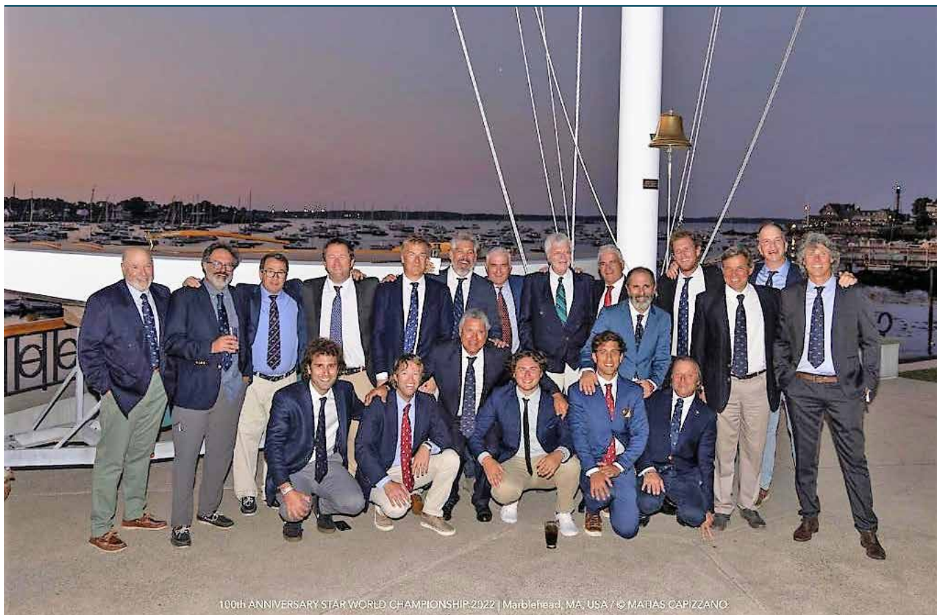
100th ANNIVERSARY STAR WORLD CHAMPIONSHIP 2022 | Marblehead, MA, USA