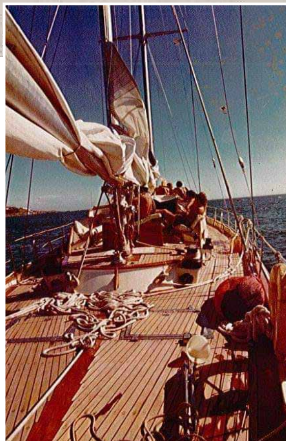
Farallón IV 1975