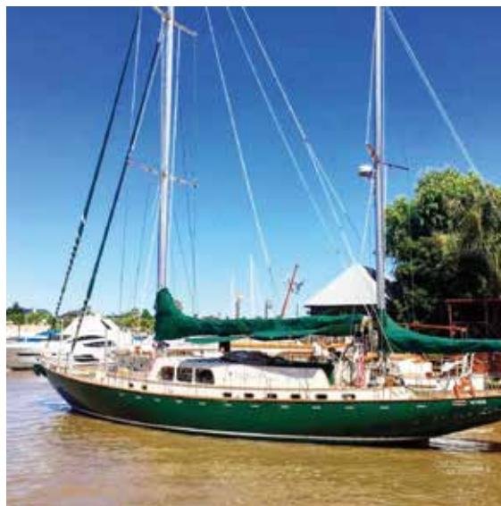
Farallón IV Actualidad