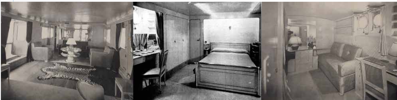
Interiores del "Margarita"

Por supuesto, tenía bodega, camarote para el capitán y la oficialidad con su baño y un lavadero eléctrico.