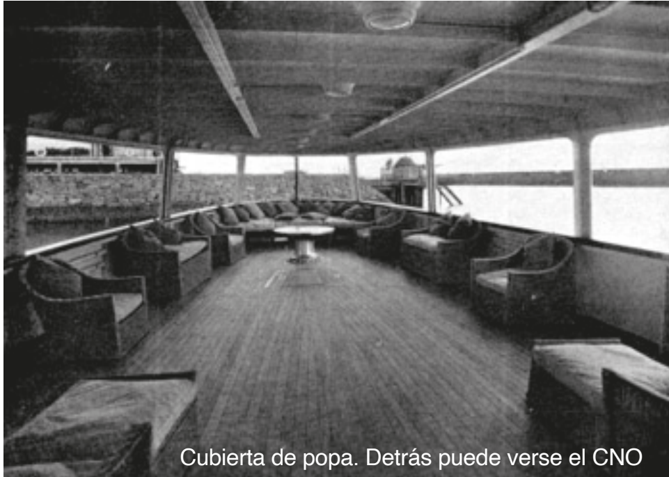
Cubierta de popa. Detrás puede verse el CNO