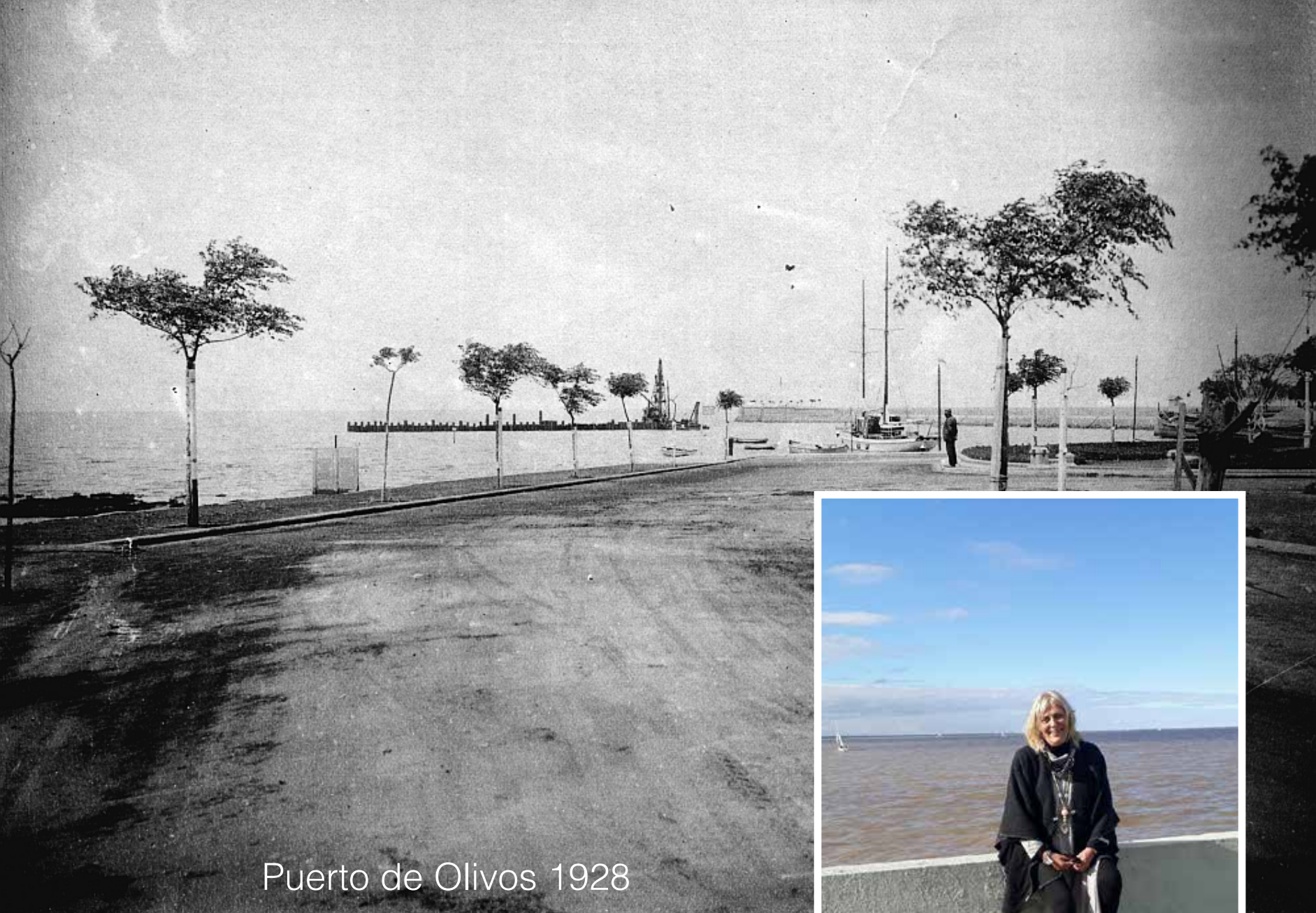
Puerto de Olivos 1928