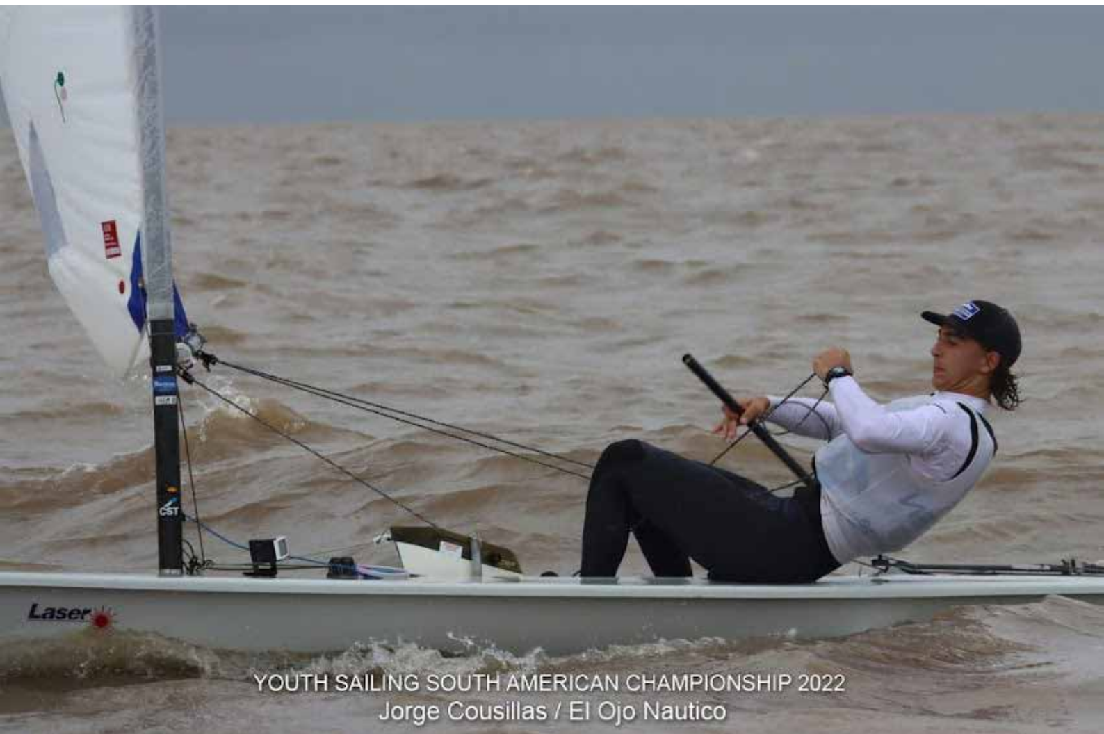
YOUTH SAILING SOUTH AMERICAN CHAMPIONSHIP 2022