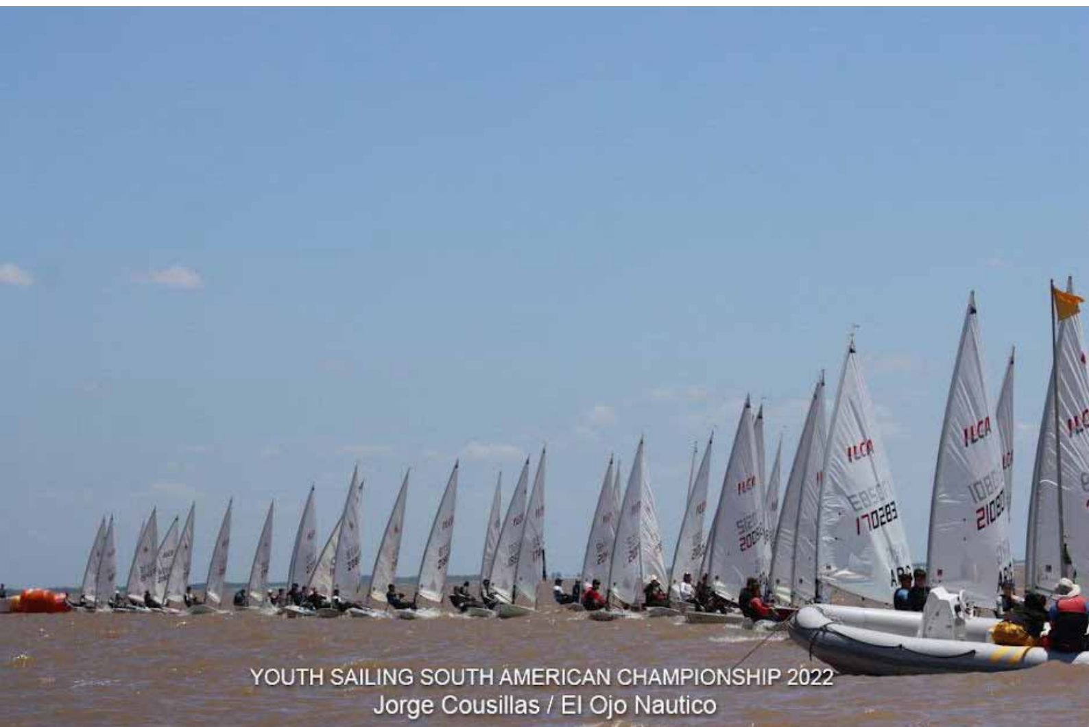
YOUTH SAILING SOUTH AMERICAN CHAMPIONSHIP 2022