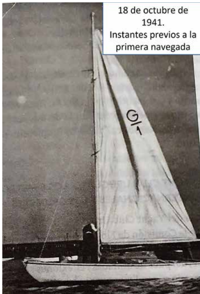
18 de octubre de 1941. Instantes previos a la primera navegada