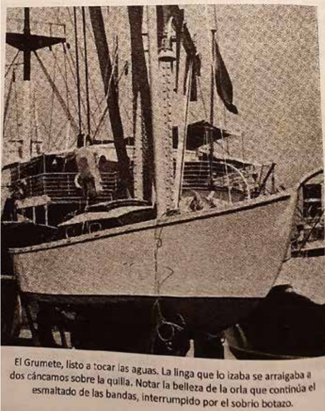
El Grumete, listo a tocar las aguas. La linga que lo izaba se arraigaba a dos cáncamos sobre la quilla. Notar la belleza de la orla que continúa el esmaltado de las bandas, interrumpido por el sobrio botazo.