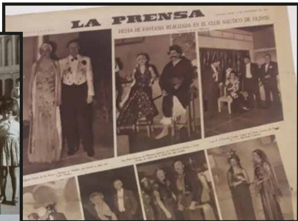
Fiesta fantasía CNO- 2 de diciembre 1938